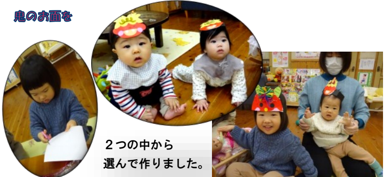
2つの中から 選んで作りました。

~乳幼児期に子どもの喜びをしてお返ししよう~ 子どもが喜びること? ふれあいあそび (いないいないばあ!) (1本橋こちょこちょ) など ・たくさんの喜びと笑顔をお母さんやお父さんとした子どもは、誰とも喜び と悲しみを分かち合える人に成長します ↓ 人間が生きていくうえで、最も大切な力(人間関係を築く力)となります。